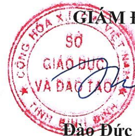
Đào Đức Tuấn